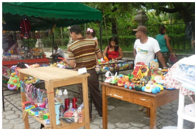
Artesanos, comerciantes, sector agroindustria y alimentos exponen sus productos durante la Noche Cultural Segoviana. Contenido y fotos: Lic. Consuelo Lic. Consuelo González.