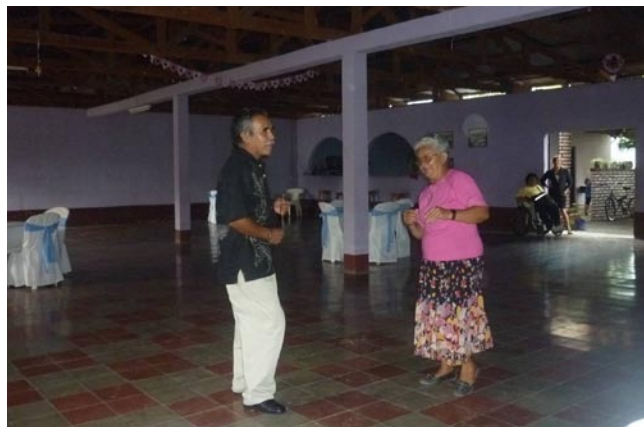
Oficina de Desarrollo Económico Local Ocotlán, celebró el día del Padre, con la participación de los prestadores de servicios.